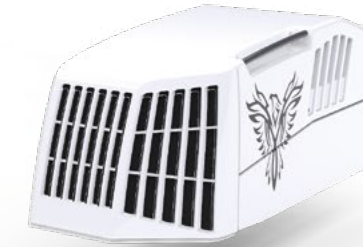
MOTOR DIÉSEL AST-2P/X